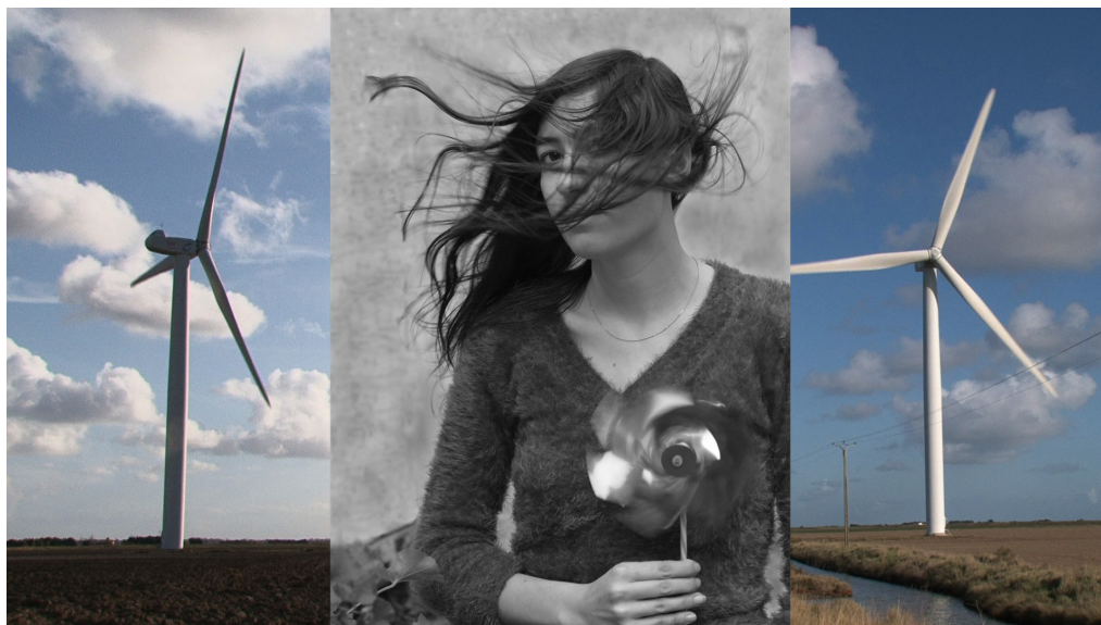
Marie dans le vent, 2014

3, rue du Cloître Saint-Merri - 75004 Paris