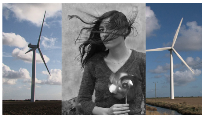
Marie dans le vent, 2014

Photographie et tirage argentique sur baryté warmtone, vidéo HD blu-ray en boucle 108 × 192 cm - Format 16/9ème